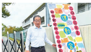
神戸大学付属特別支援学校運動会を見学