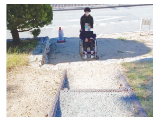
あそびの丘の階段

丘陵地故に安全な傾斜度の確保が困難なこと、遊具エリアが減少するなども考えられる。 あそびの丘の利用状況、利用者ニーズを踏まえながら、引き続き、できるだけ利用しやすいような工夫を検討していきたい。