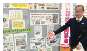
やまてまつりにて