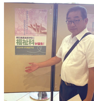
福祉の就職説明会にて

第1回目の体験学習会にも参加された24名を含む中学生72名、保護者31名が参加。授業体験ではアイマスクを着用し、白杖を使いながら室内を歩く視覚障害者体験、並びに訓練用の人形とAEDを使用して心臓マッサージとAED操作の体験を行った。