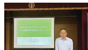
市のワークショップを見学 「大久保駅周辺市有地のあり方について」