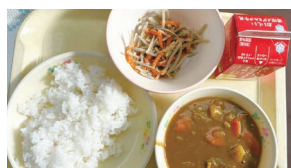
市内小学校にて学校給食の視察