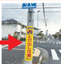
注意喚起表示設置