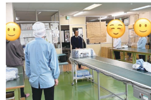
就労移行支援事業所を訪問

福祉現場で働く職員の過度な事務負担等の軽減について、利用者のサービスの向上はもとより、福祉職場における必要職員数の削減であったり、職員の定着につながる重要な取り組みであると認識している。6月に作成した「あかしの福祉の好事例集」を中心に事務負担軽減につながる取り組みのヒントになる情報を発信をしていく。他の事例等も調査研究をしながら、より効果的な支援策について何ができるかしっかり考えていきたい。