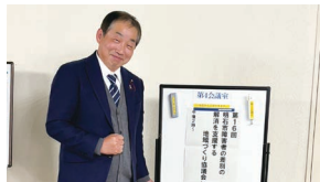
障害者の差別の解消を支援する 地域づくり協議会に参加