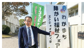
わがまち障がい福祉フェアを見学 20の福祉事業所さんが参加