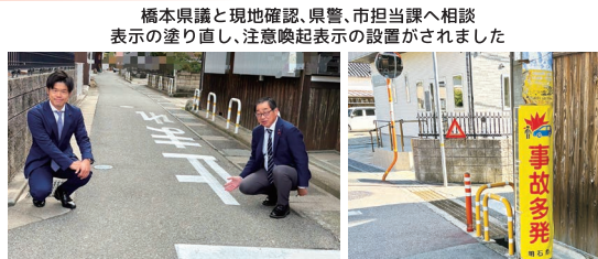
橋本県議と現地確認、県警、市担当課へ相談 表示の塗り直し、注意喚起表示の設置がされました