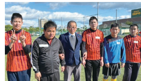
あかし知的障害者フットボール体験会 たまこくらぶの皆さんと