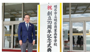
明石商業高校創立70周年 記念式典にて