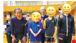
スペシャルオリンピックス明石 スペシャル卓球の練習に参加