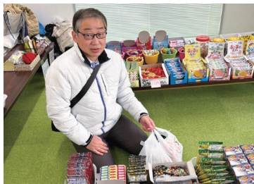
西大窪厚生館祭り カフェ・だがし市 訪問