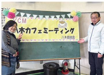
八木カフェミーティングに参加