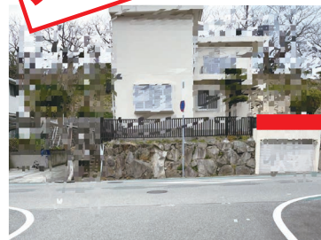
危険個所にミラーの設置ができないか