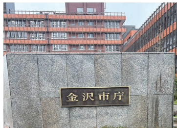
障害福祉課に 医療的ケア児の移動支援について訪問