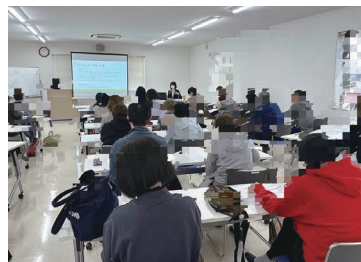
虐待防止研修会 傍聴