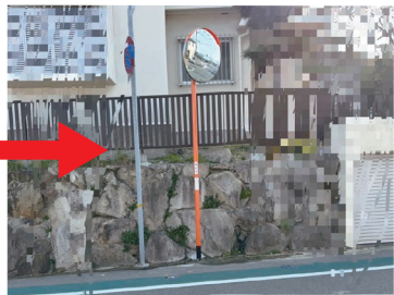
市に要望し、ミラーが設置される