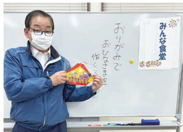
みんな食堂に参加