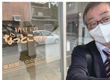
福祉事業所「納豆工房なつとこちゃん」訪問