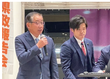
あかし市民広場での市政報告会