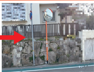
市に要望し、ミラーが設置される