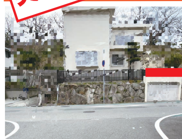
危険個所にミラーの設置ができないか